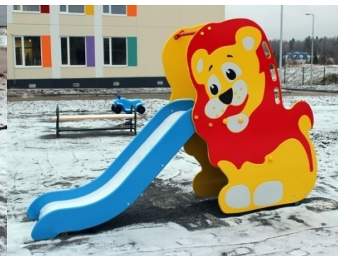
Игровая площадка. Горка.

Есть также отдельные спортивные площадки , оборудованные "зрительской" трибуной, "змейкой" и небольшим спортивным комплексом с перекладиной, кольцами, лестницей и т. п.