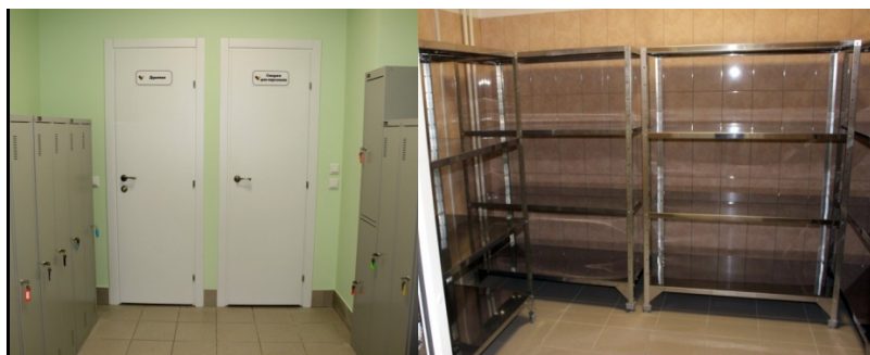
Пищевблок. Гардероб, душевая, санузел.