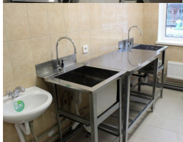
Пищевлок. Мясно-рыбный цех.

Поставка продуктов осуществляется в рамках муниципального контракта МАУ «Петроснаб», сопровождается сертификатами качества, соответствует требованиям ГОСТ.