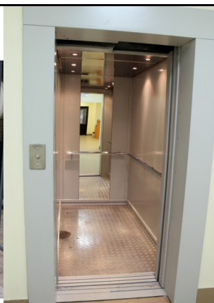
Жолл I-го этажа. Лифт.