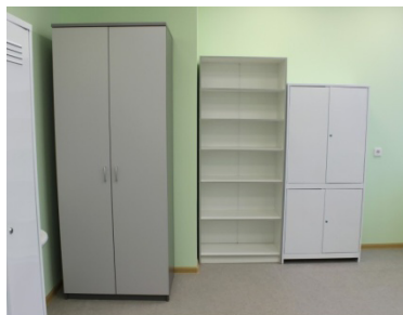
Медицинский блок. Медицинский кабинет.

Имеется медицинский блок, состоящий из медицинского кабинета, процедурной и санузла с местом для приготовления дезинфицирующих средств.