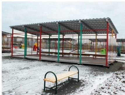
Игровая площадка. Веранда.

А чтобы во время активных игр ребята «крепко стояли на ногах», пол беседки выложен долговечным, качественным, нескользким покрытием из террасной доски