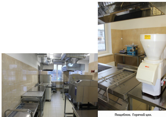
Пищевлок. Горячий цех.

Кухонное оборудование и посуда имеются в достаточном количестве. Здесь есть всё, что нужно, чтобы приготовить вкусную и полезную еду. Причём вся техника промышленного назначения.