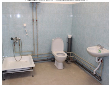
Туалет с местом для приготовления дезинфицирующих средств.

Оснащен всем необходимым оборудованием: 2 медицинских холодильника для хранения лекарств; электронные весы; ростомер; тонометр; 2 бактерицидные лампы; медицинские шкафы для хранения лекарств и документов; кушетка; водонагреватели;