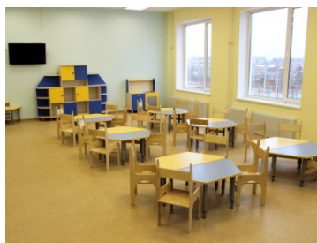
Группа. Игровая комната.

Все игровые комнаты обставлены детской мебелью для игр и занятий — стеллажами, регулируемыми по высоте столами и стульчиками. Каждое групповое помещение также оснащено игрушками, дидактическими играми и пособиями, магнитными досками, телевизором.