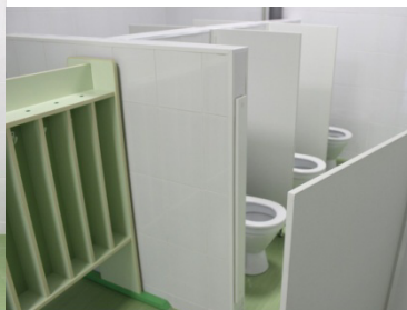
Группа. Туалет для детей.

В просторной спальне с приглушённым освещением установлены 25 кроваток из массива. Воздух в спальне и игровой комнате очищается ультрафиолетовым облучателем (медицинским прибором для экологичной дезинфекции воздуха в помещениях в присутствии людей).