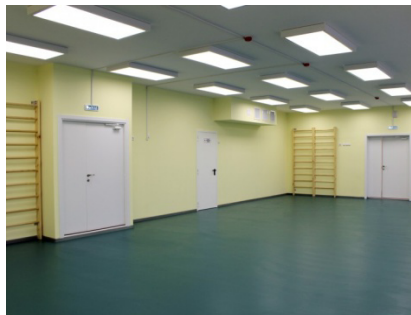
Зал для спортивных занятий.

- Физкультурный зал для организации двигательной активности детей, физкультурно-оздоровительной работы. Зал для спортивных занятий аналогичен залу для музыкальных занятий по площади 107,7 кв.м и наличию кладовой (только теперь уже для спортивного инвентаря). Окна закрыты специальными защитными сетками.