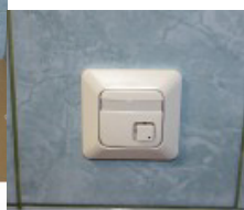
Туалет для маломобильных групп населения. Трассовый вызов.

На первом этаже располагаются пост охраны, две группы для самых маленьких детсадовцев, кабинет педагога-психолога «Умничка», столовая для персонала, пищеблок, медицинский блок, прачечная с гладильной, помещение для уборочного инвентаря с местом для приготовления дезинфицирующих средств (такое помещение предусмотрено на каждом этаже) и лифт.