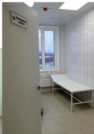
Медицинский блок. Процедурный кабинет.