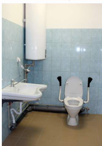
Туалет для маломобильных групп населения.