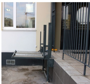
Подъёмник на крыльце.