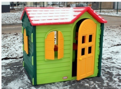
Игровая площадка. Домик.

Кроме того, на каждой игровой площадке установлены скамейки, горка, качели, домики и песочницы.